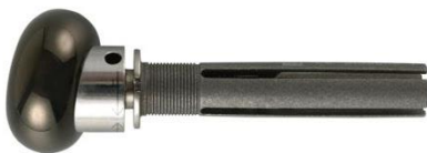
Implant pyrocarbone « MoPyc »

Il existe plusieurs variantes de prothèses (implant en Pyrocarbone, implant à double mobilité) dont l'utilisation dépend de chaque opérateur :