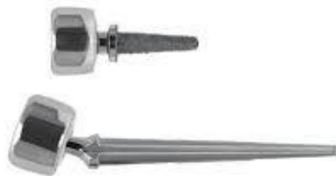
Implant à cupule mobile