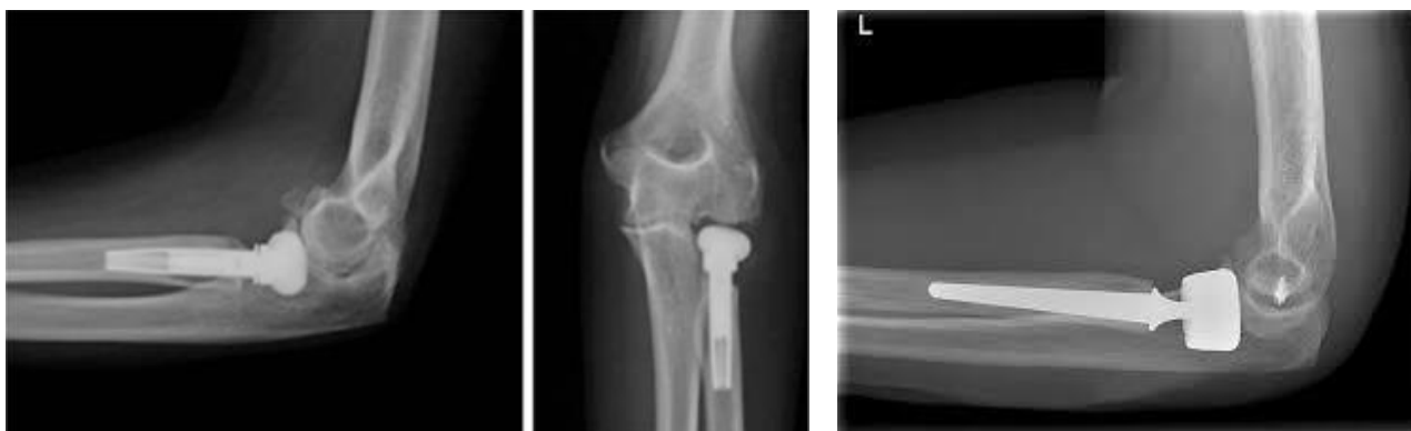
Prothèse en Pyrocarbone

• Le geste chirurgical : l'intervention s'effectue sous garrot pneumatique, le membre supérieur reposant sur une table. Par une incision à la face externe du coude, la tête radiale est exposée et recoupée au col du radius ; le fût médullaire est alésé et on impacte la prothèse dont la taille a été choisie par un gabarit (ces prothèses sont dites « modulaires »). On réparera à la demande une rupture de ligament ou une fracture associée du coude. Un drainage est mis en place et une attelle pour immobiliser le coude.