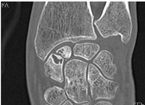
Pseudarthrose du scaphoïde

Le geste chirurgical consiste à remplacer le fragment défectueux par un petit implant en Pyrocarbone (matière quasi inaltérable qui offre un coefficient de friction proche du cartilage) en forme d'olive dont la position s'adapte aux mouvements du poignet et reconstitue une bonne congruence articulaire :